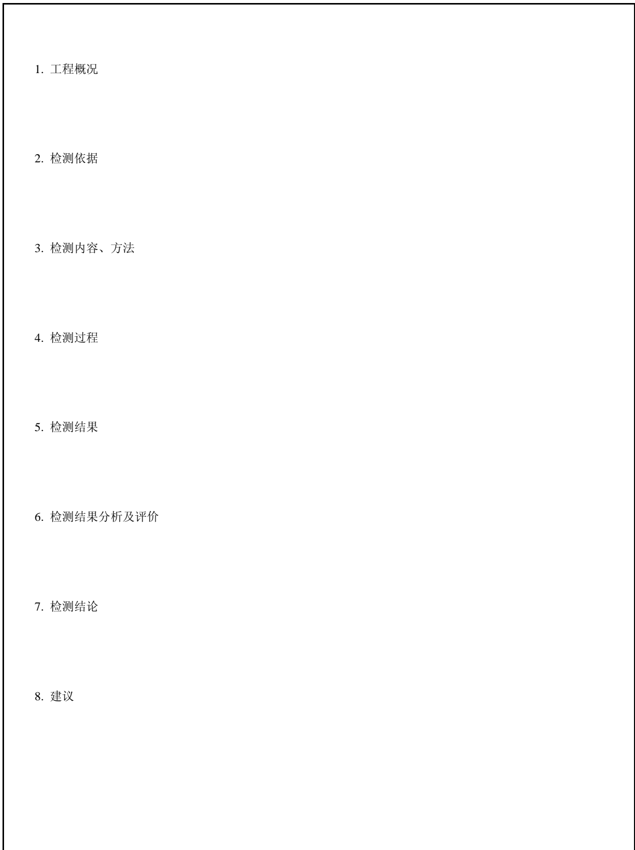
图 C.3 检测报告正文